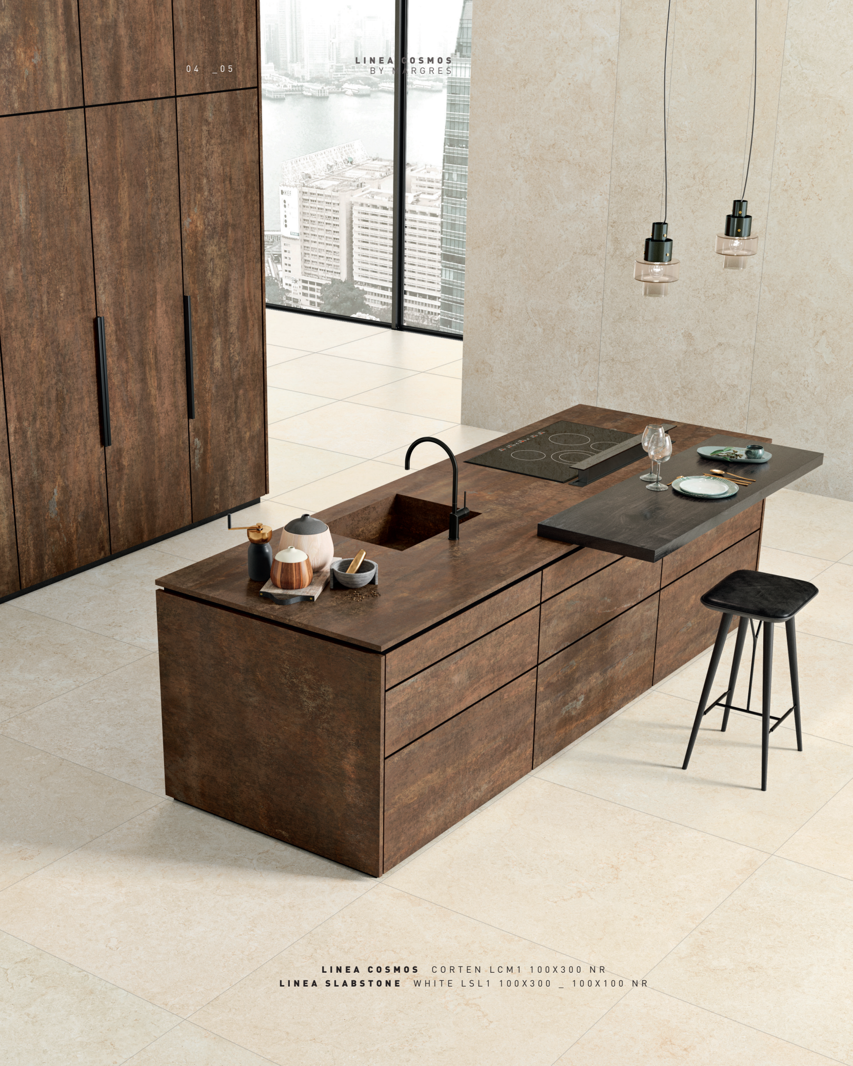
LINEA COSMOS CORTEN LCM1 100X300 NR LINEA SLABSTONE WHITE LSL1 100X300 _ 100X100 NR