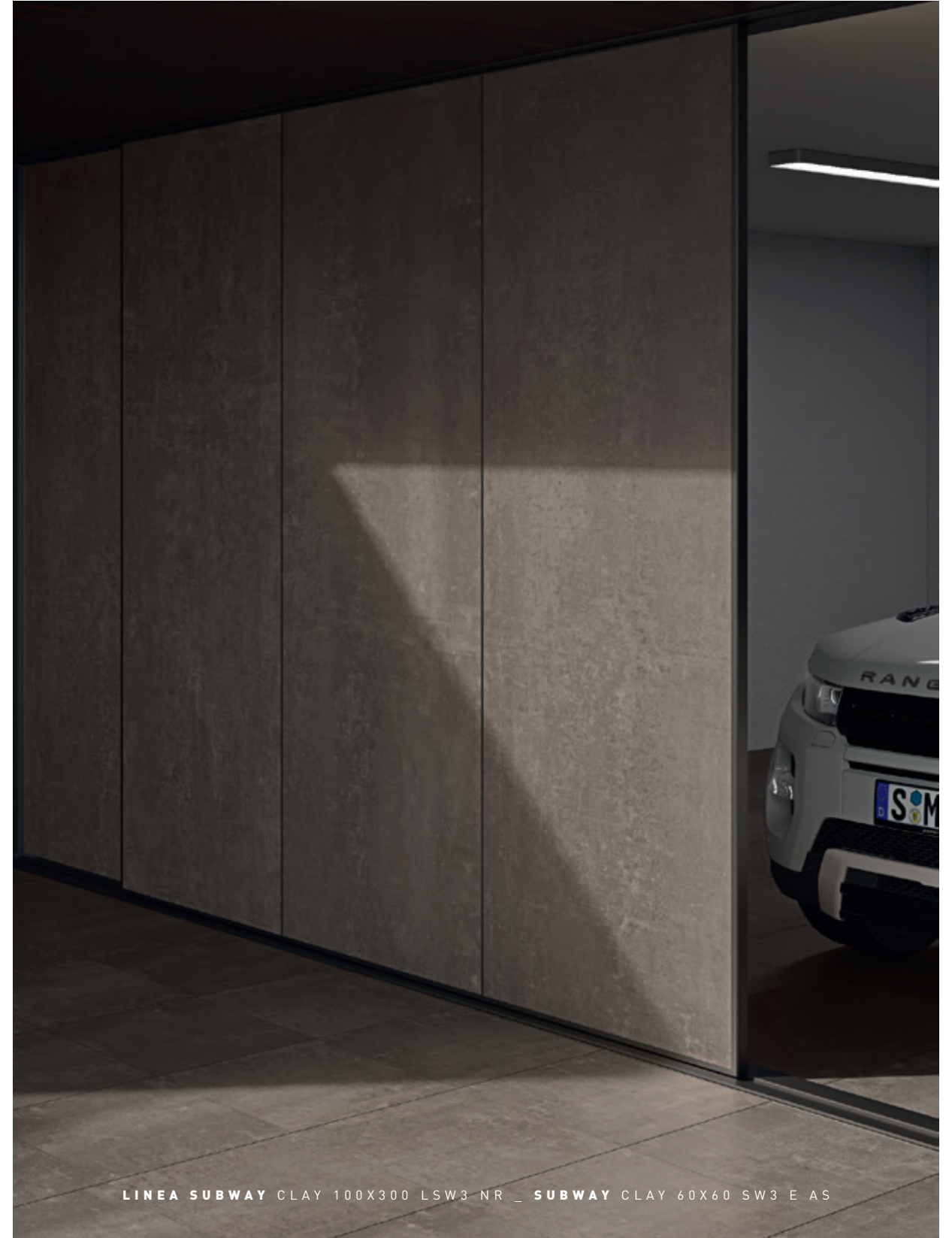
LINEA SUBWAY CLAY 100X300 LSW3 NR _ SUBWAY CLAY 60X60 SW3 E AS