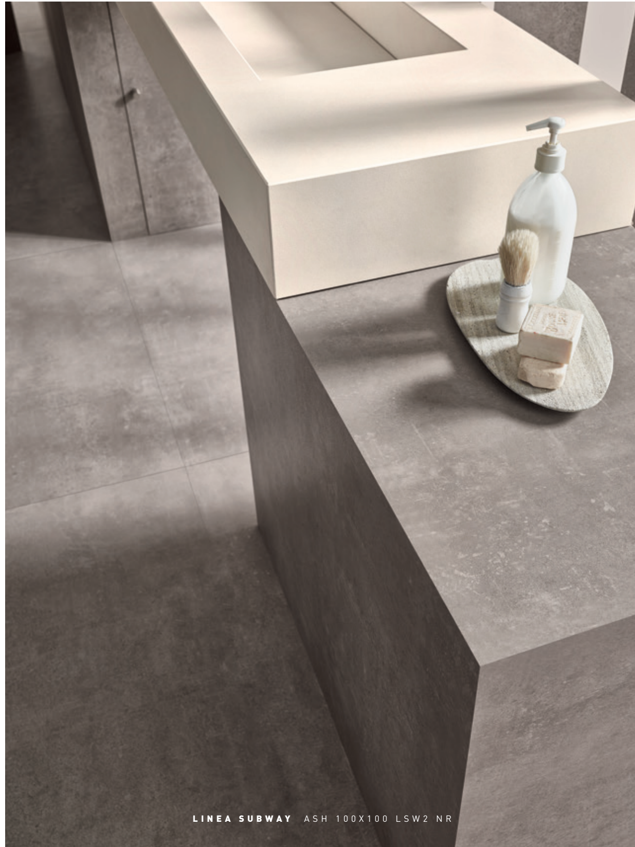
LINEA SUBWAY ASH 100X100 LSW2 NR