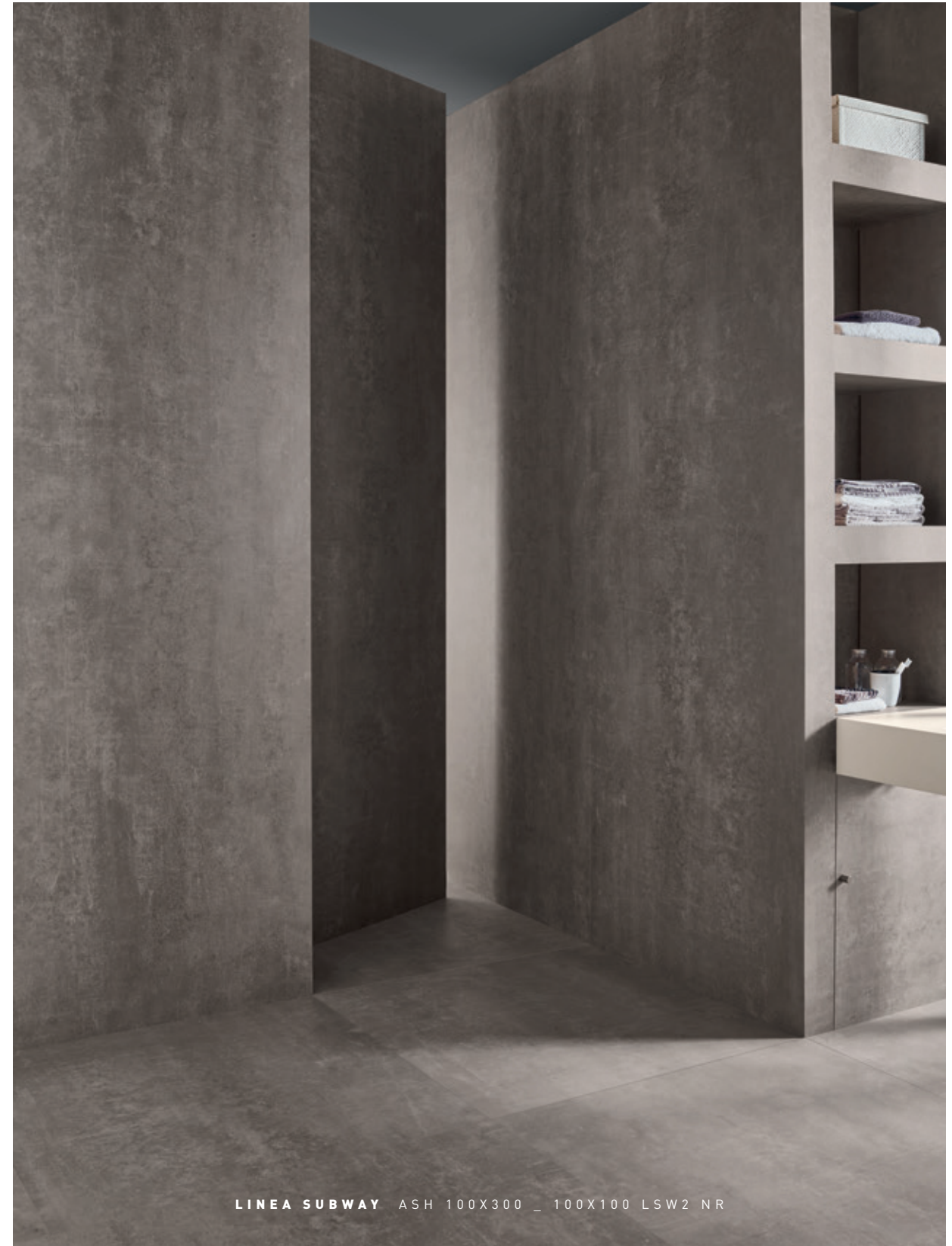
LINEA SUBWAY ASH 100X300 _ 100X100 LSW2 NR