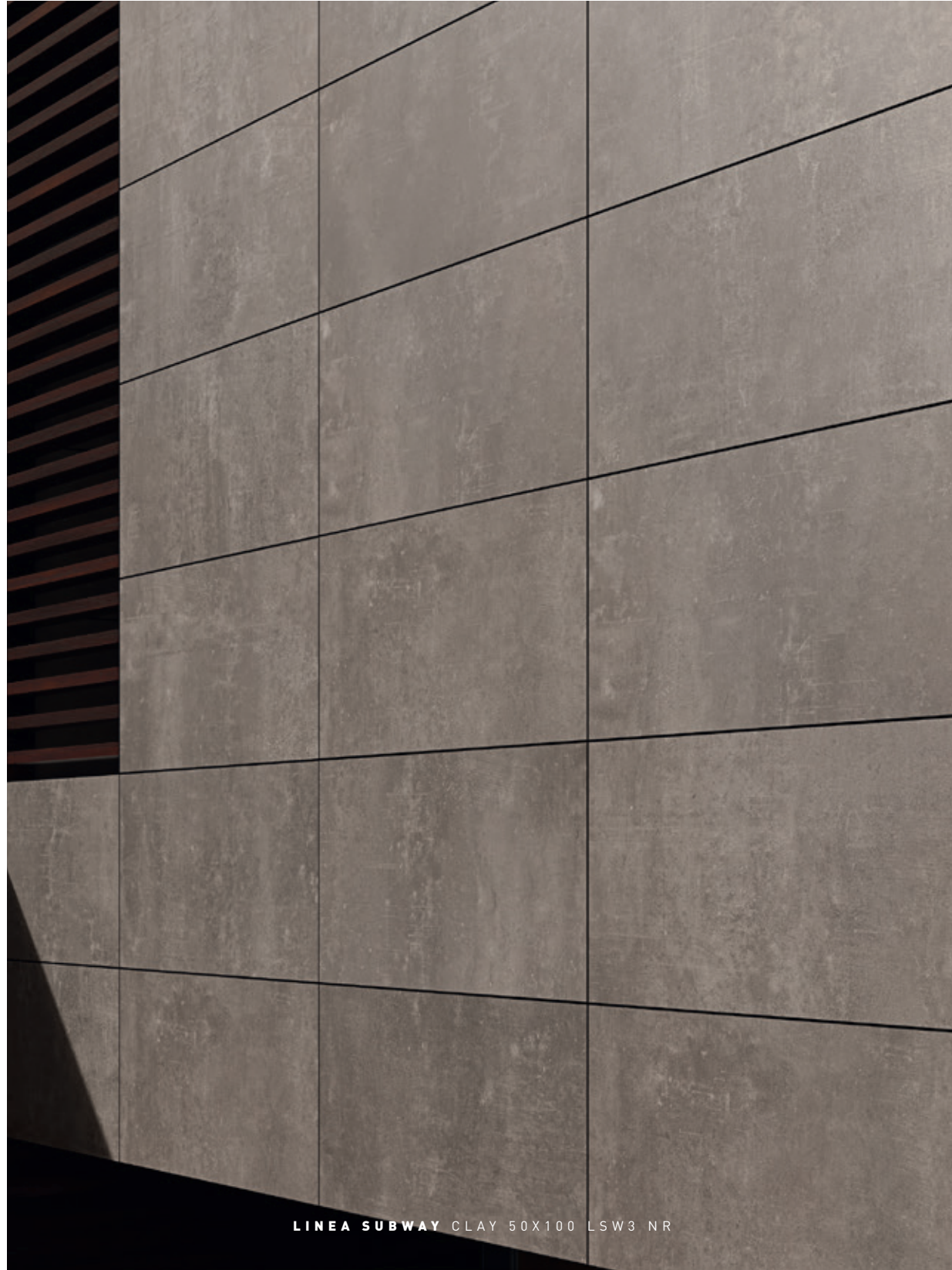
LINEA SUBWAY CLAY 50X100 LSW3 NR