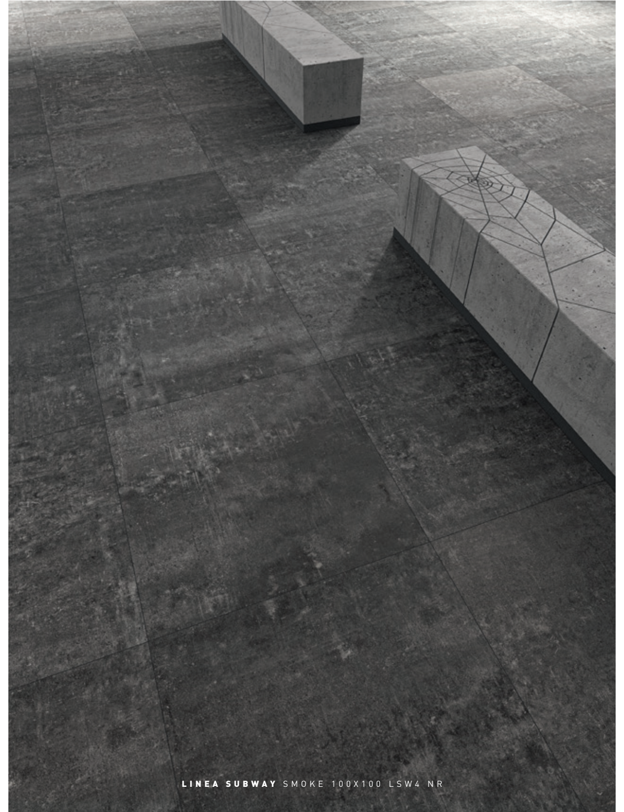
LINEA SUBWAY SMOKE 100X100 LSW4 NR