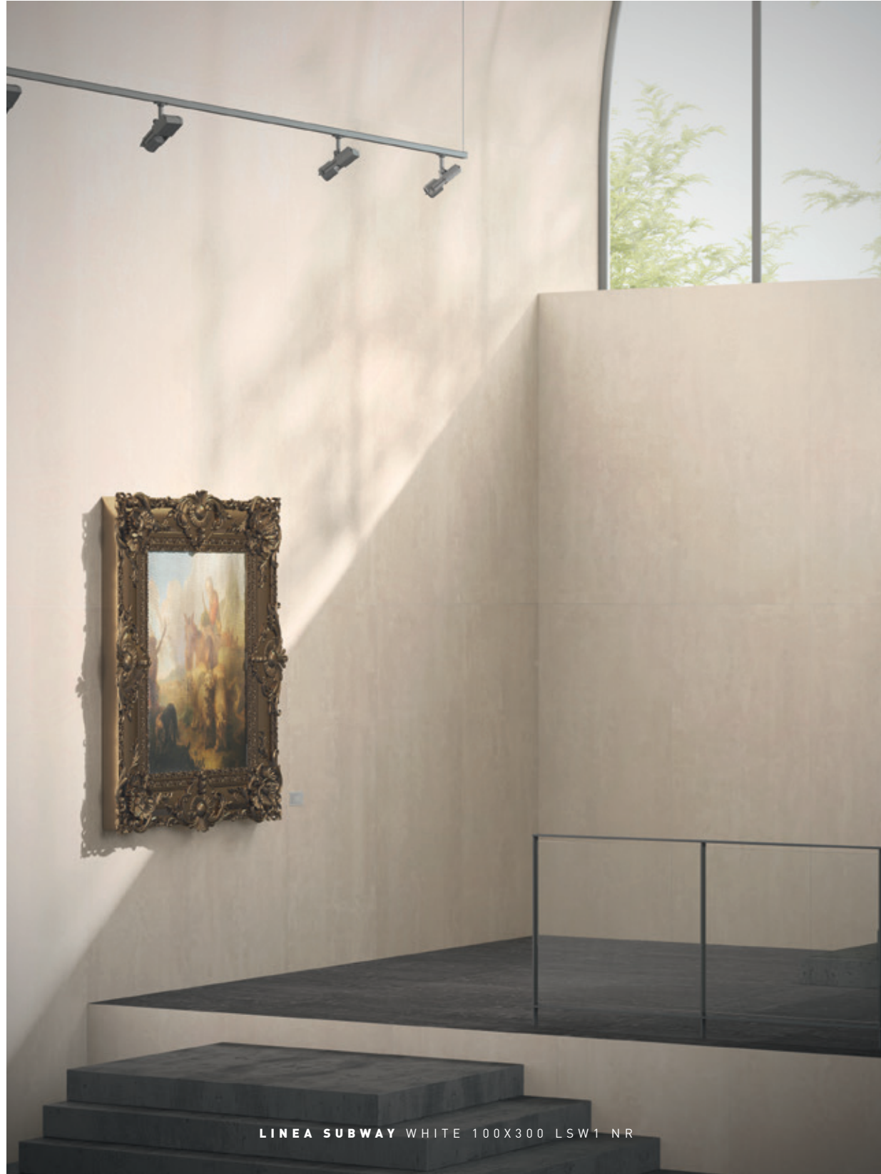
LINEA SUBWAY WHITE 100X300 LSW1 NR