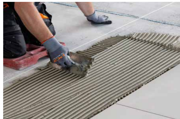
Für die Belegung von Zementestrichen/zementäre Heizestriche älter > 3 Tage (sobald begehbar).