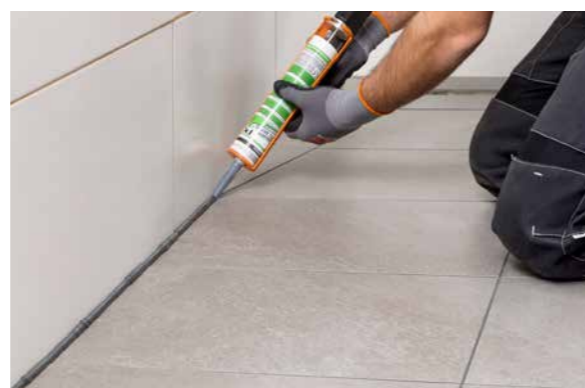
PCI Silcofug E ist beständig gegenüber handelsüblichen Haushaltsreinigern und Desinfektionsmitteln; die geschlossene Fuge kann problemlos gereinigt werden.