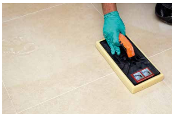
PCI Nanofug Premium – für Fugen mit hohem optischen Anspruch.