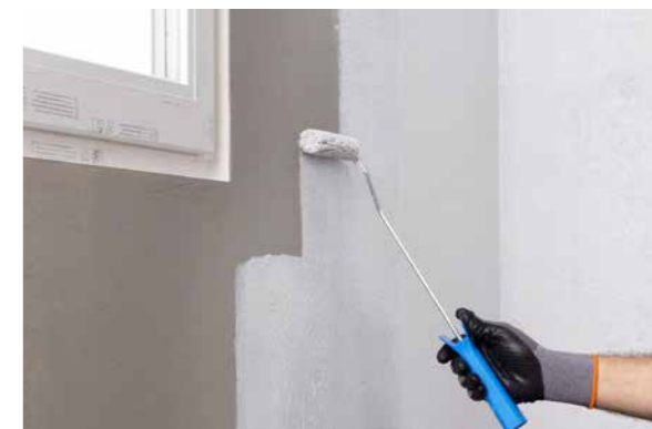
PCI Lastogum wird 2-lagig durch Rollen, Streichen oder Spachteln auf den Untergrund aufgebracht.