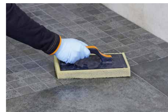
Speziell für die Verfugung von optisch hochwertigen Oberflächen wie z. B. Fliesen, Mosaik usw.