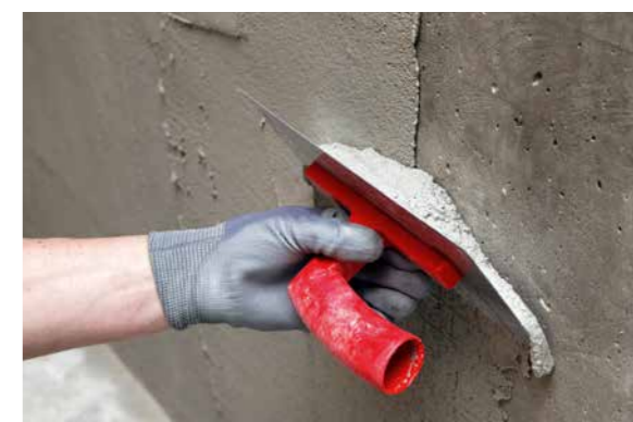
PCI Pericret lässt sich sehr geschmeidig verarbeiten.