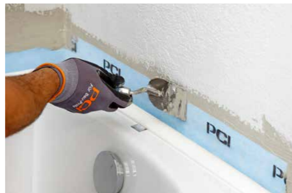
PCI Pecitape WDB – einziges Wannendichtband mit allgemeinem bauaufsichtlichen Prüfzeugnis.