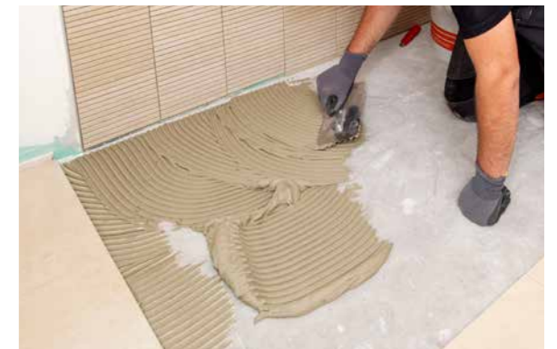
Variables Leistungsspektrum – für alle Untergründe und alle keramischen Beläge.