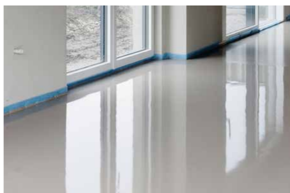
Entspanntes Arbeiten: Anrühren – Ausgießen – Läuft!