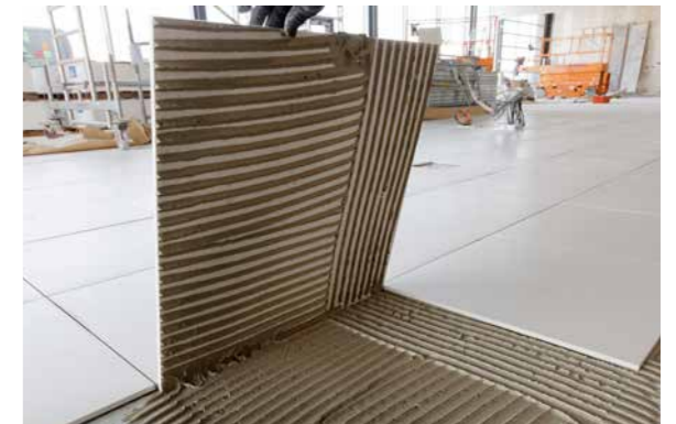
Ideal zum Verlegen von großformatigen Bodenfliesen.